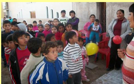
Cáritas La Rioja

No es raro tampoco que en esos momentos sintamos la presencia bondadosa de Dios que nos anima y que nos muestra la dinámica de “los cinco panes y los dos peces” (ver Jn 6, 1-15), cuando Jesús da de comer a la multitud con tan poco y aportado por un niño.