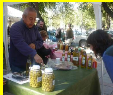
Canastas Navideñas en el marco del Comercio Justo

“Las canastas tienen productos artesanales, de calidad y amigables con el medio ambiente, al mismo tiempo representan el esfuerzo de muchos pequeños productores a quienes venimos apoyando para generar formas más apropiadas de intercambio de bienes”, aseguran desde la diocesana.