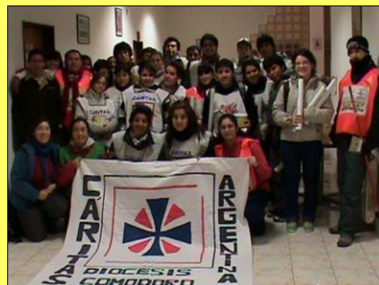
Cáritas Comodoro Rivadavia

Cáritas lleva adelante su misión con la valiosísima colaboración de más de 32.000 voluntarios en todo el país. A todos ellos queremos agradecerles su solidaridad y compromiso.