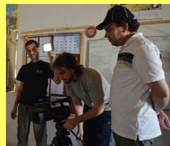
Producción de materiales.