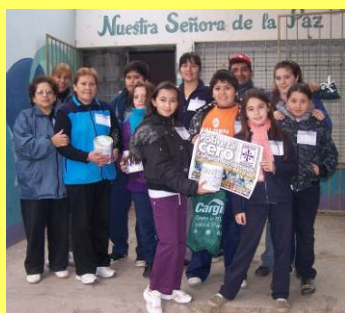
Cáritas Bahía Blanca