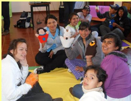
Cáritas Santo Tomé

¿Qué hizo falta en aquella oportunidad para que la multitud se fuera satisfecha? En primer lugar, la presencia de Jesús; en segundo lugar, los pocos panes y peces que había, pero que tenían que estar para poder ser repartidos; luego (y junto con los panes y peces) el niño que con corazón generoso puso en común lo que tenía y que tal vez llevaba para su familia, o le habían dado sus padres para que comiera él.