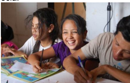
Barrio Colonia San Francisco