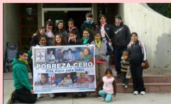
Cáritas Río Cuarto