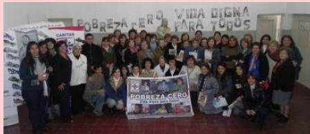
Cáritas San Rafael