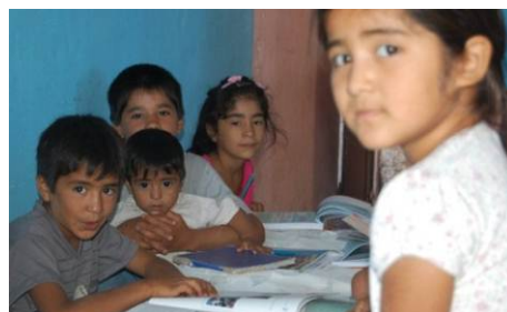
Barrio Colonia Osvaldo

“El objetivo es que cada comunidad pueda hacerse cargo de la educación de los niños. Además del apoyo escolar, desde hace algunos años capacitamos a las mamás para que ellas mismas puedan llevar adelante las tareas para la educación de sus hijos”.