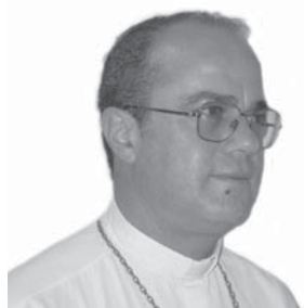
Por Fernando María Bargalló

Presidente de Caritas Argentina Obispo de Merlo-Moreno