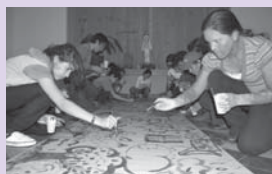
Mochileros y ATLs en el encuentro de Corrientes.

- Cursos de metodología comunitaria en Caritas Brasil. (4)